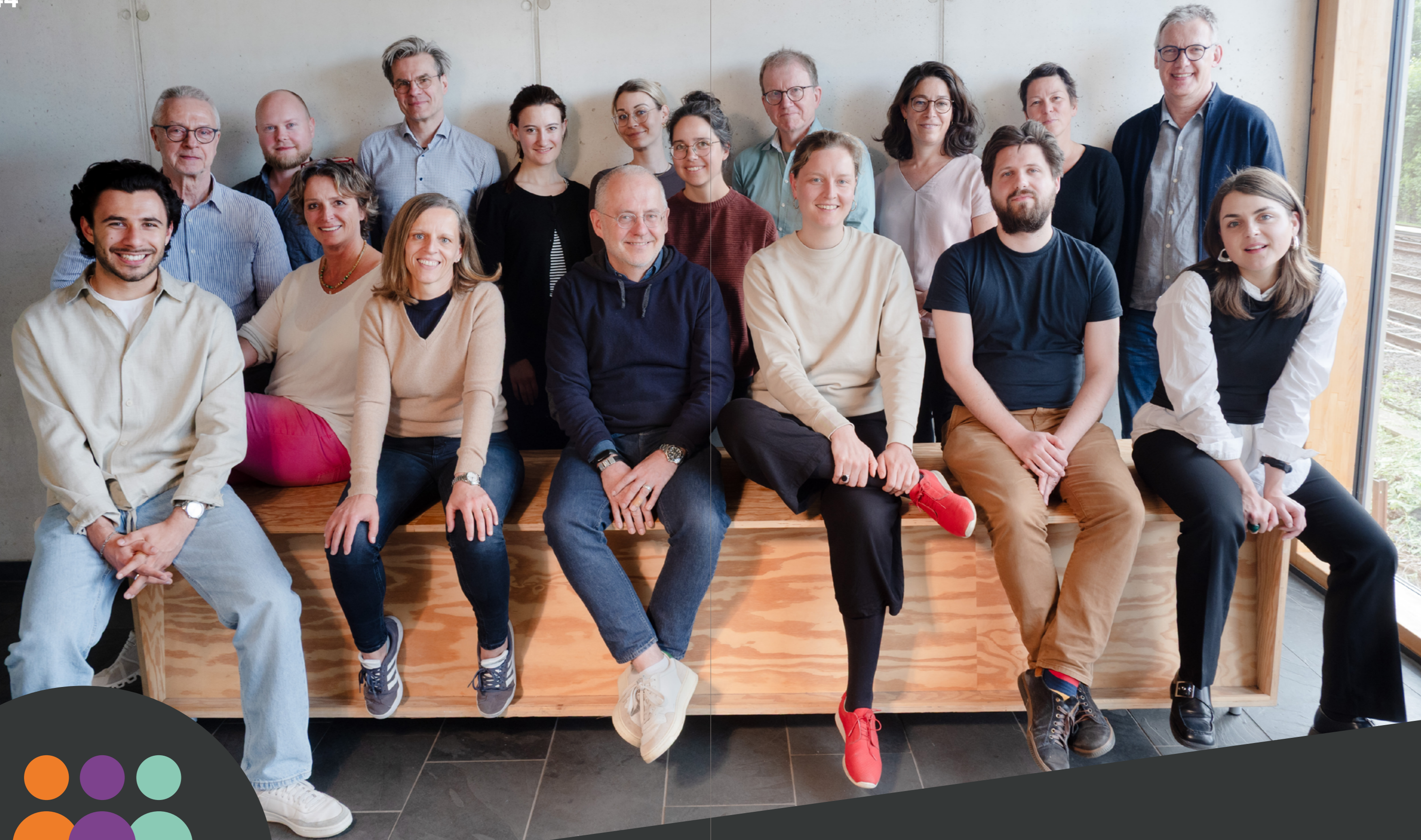
Starke Demokratie beim Präsenztreffen im Frühjahr 2025 in Hamburg