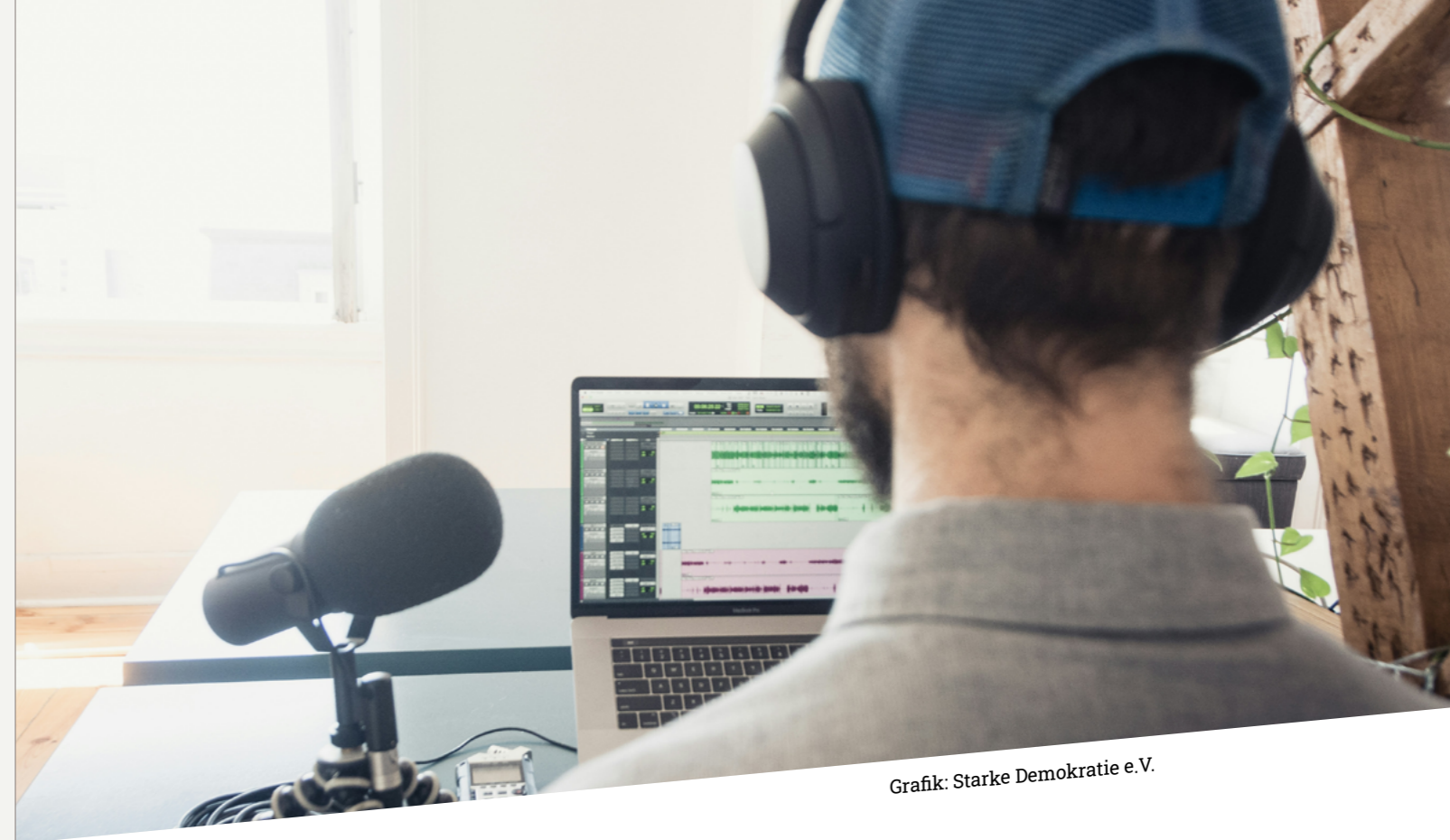
Grafik: Starke Demokratie e.V.

S eit Juli 2025 erschien keine neue Episode. Da die AG Podcast rein ehrenamtlich getragen wird, waren die Ressourcen begrenzt. Seit Anfang 2026 nimmt die Arbeit in der AG wieder Fahrt auf - neue Folgen sind in Planung.