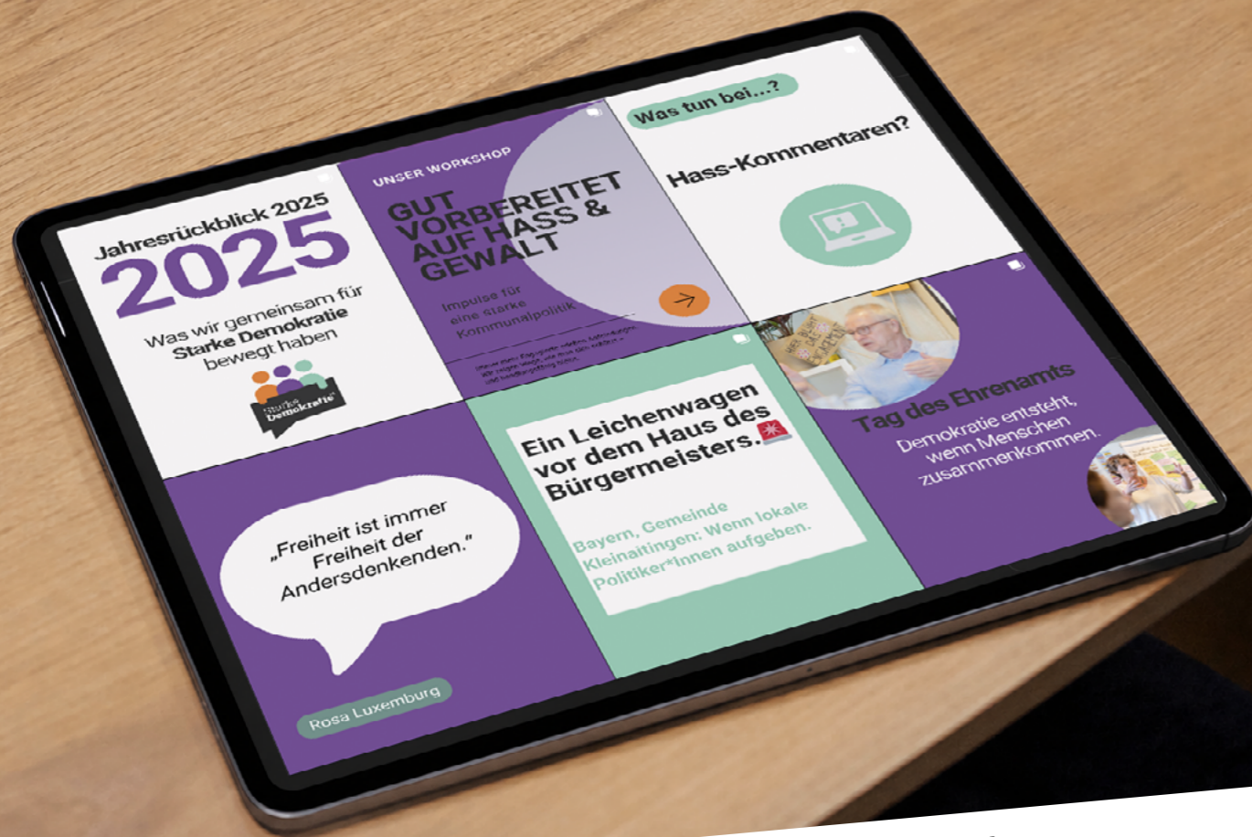
Grafik: Starke Demokratie e.V.